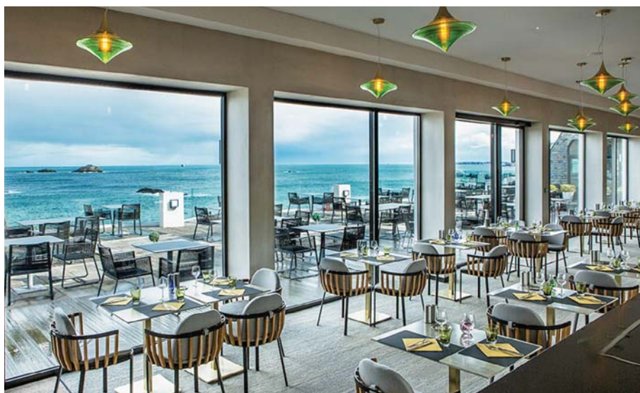
Erfrischender Ausblick vom Restaurant des Hotels Thalassa Dinard

Anschliessend fahren wir weiter nach Cancale, das für seine Austern-Zucht bekannt ist. Insbesondere im Hafen «La Houle» mit seiner malerischen Häuserzeile ist die Auster das zentrale Thema. Bei einem geführten Rundgang erhalten wir Einblicke in die Stadt sowie Informationen rund um die Austern-Zucht. Und wer Appetit verspürt, kann an zahlreichen Verkaufsständen geöffnete und mit Zitrone versehene Austern sofort verzehren. ▶