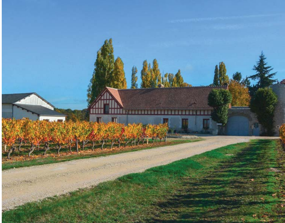
Weingut Domaine le Portail