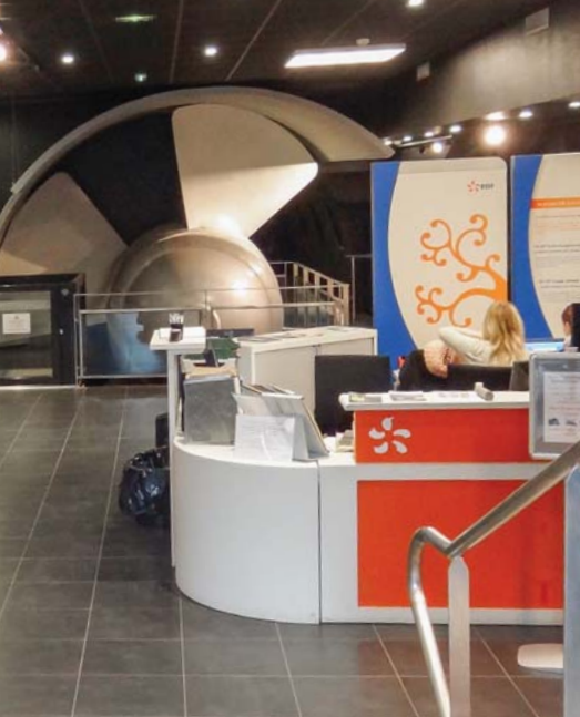
Besucherzentrum des Gezeitenkraftwerks