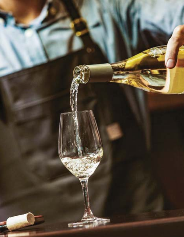
Weindegustation in Le Cheverney