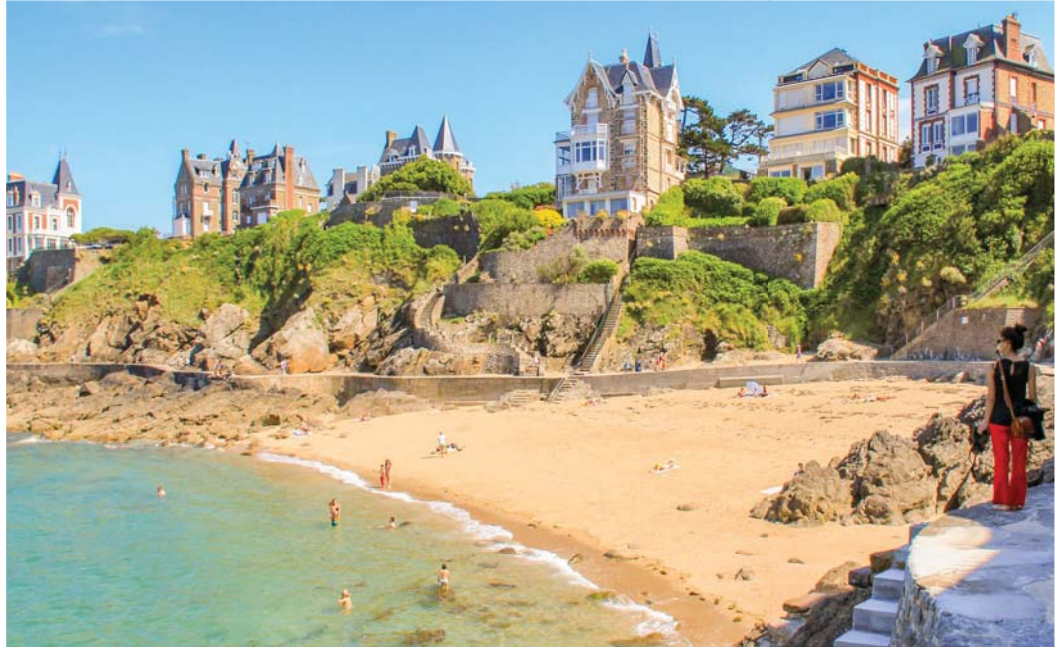
Geschützte Buchten und mondänes Flair in Dinard

durch die Gezeiten bedingt zweimal am Tag vom Meer in die Bucht der Rancemündung und zweimal am Tag wieder ins Meer zurück durch die Turbinen strömt. Bei einer geführten Besichtigung im Besucherzentrum erhalten wir einen detaillierten Blick in die Technik des Kraftwerks und erfahren Interessantes über den Bau und die Funktionsweise. Im Anschluss setzen wir unsere Fahrt nach Saint-Malo fort.