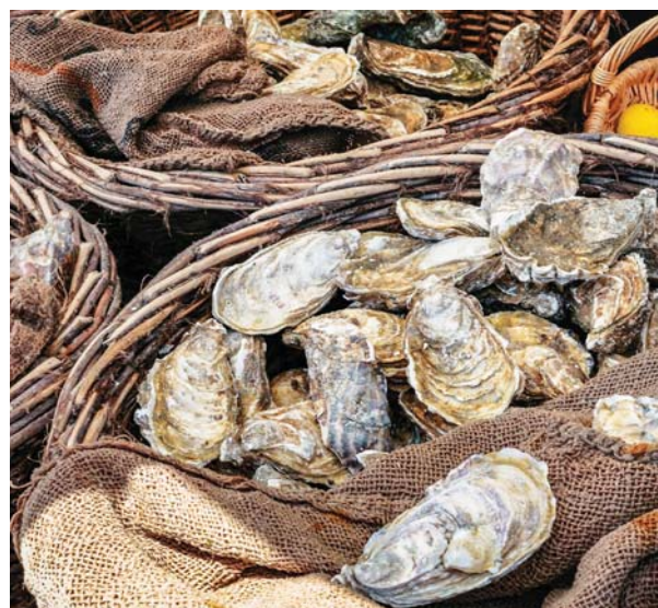
Frische Austern in Cancale